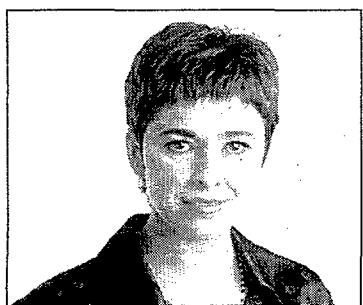
Isabel Gemio presenta el espacio 'Hablamos claro'. 21.30 horas.