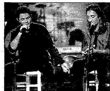
Ketama, protagonistas de 'Un siglo de canciones'. 21.40 horas.