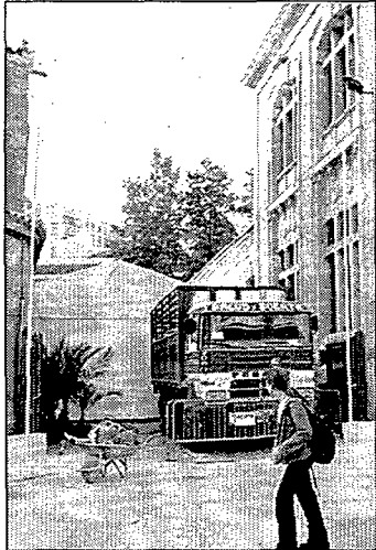
Los ruidos llegan a las aulas.