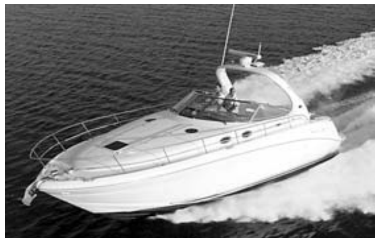
SEA RAY. La Sea Ray 395 Sundancer tiene mucha calidad. / MOTOR

de BMB International-Yates Alemanes; las Monterey 245 Cruiser