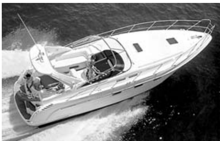
SEALINE. El modelo S38 de Sealine navegando. / MOTOR