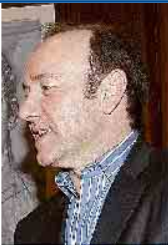
Kevin Spacey.

Un cuadro con la imagen de un Jesús inmerso en una orgia homosexual con los doce apóstoles, pintado por un artista ateo y expuesto en el museo de la Catedral de Viena, ha causado tal indignación que ha sido retirado de la muestra. El lugar más destacado de la exposición Religión, carne y poder era para la muy polémica obra La última cena , del austriaco Alfred Hrdlicka .