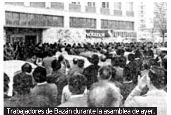
Trabajadores de Bazán durante la asamblea de ayer.

Impugnaciones. Ayer comenzó el escrutinio definitivo de los votos del 1-M. Festival de impugnaciones de UCD y PSOE. Causa principal, la no inclusión en los sobres de las papeletas nulas