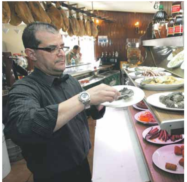
Un hostelero prepara un plato en un restaurante de Murcia.

Por ello reprende a las autonomías contrarias al déficit a la carta, «máxime cuando son éstas las que se benefician del sistema de financiación en detrimento de las que arrastran un mayor déficit —como Murcia—, y cuando son las cuentas de estas regiones las que más dudas suscitan».