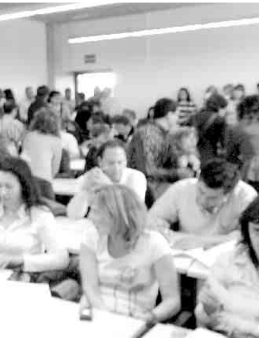
asistencia, tuvo que ser trasladado a otra sala.

Este aumento de jornada se realizará siempre dentro de un horario flexible, concretamente de 7.30 a 18 horas, de lunes a jueves; de 7.30 a 17 horas los viernes y de 9 a 13 horas, los sábados y festivos. En este último caso, los funcionarios se verán beneficiados por un 33% sobre la mínima citada.