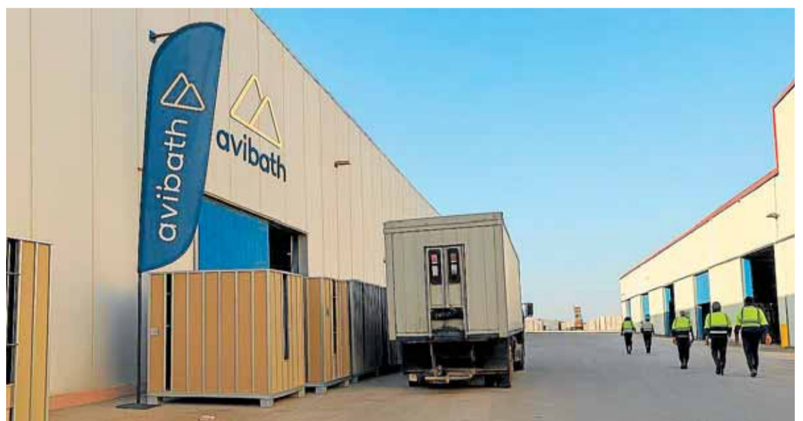
Fábrica del Grupo Avintia de construcción industrial de baños, puesta en marcha en Jumilla a finales de 2025.

Un aspecto resaltable es que del total invertido, la gran mayoría se enfoca a iniciativas de ampliación, que representaron 311,86 millones de euros, cuando en 2024 se quedó en 287 millones. En cambio, para