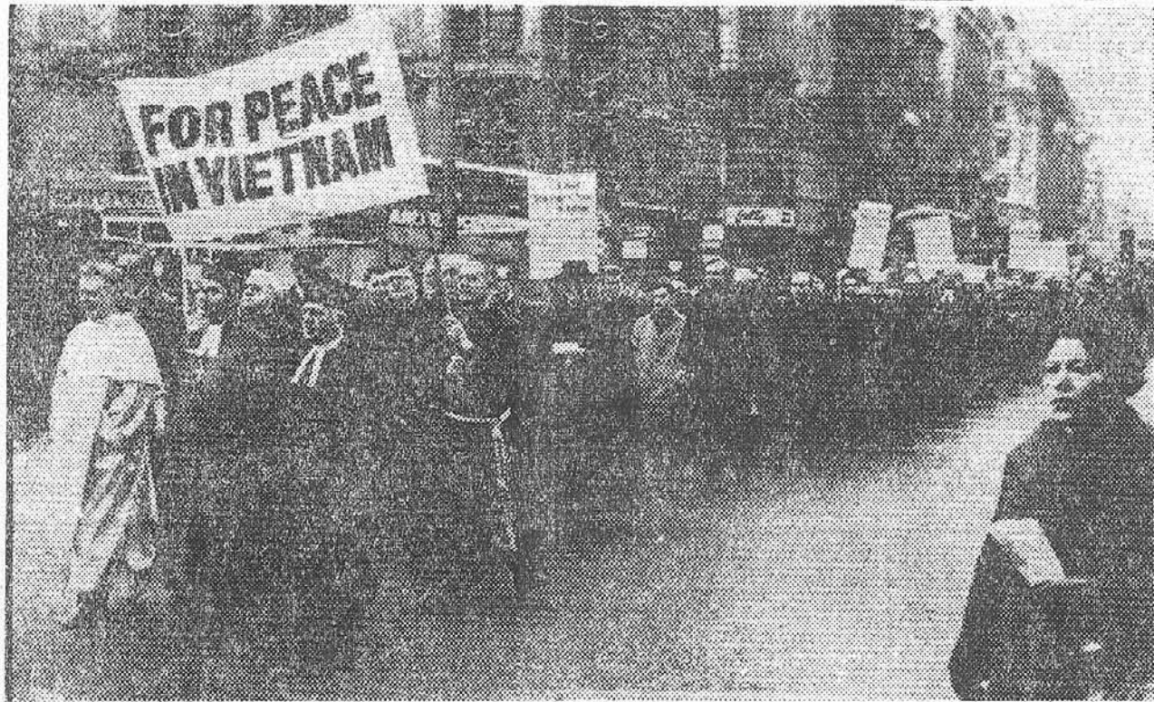
Tropas coreanas lucharon cuerpo a cuerpo contra el Vietcong (PAGINA TERCERA)

El partido de Copa de Europa Inter-E. Madrid, pedemos decir que paralizó a España. Era mucha expectación. En Madrid, por ejemplo, se suspendió una rueda de prensa en un Ministerio, y la sesión de tarde de una comisión de las Cortes; el comercio adelantó la hora de cierre. En Murcia, las calles estuvieron vacías durante la retransmisión por TVE del encuentro. Los aficionados especialmente los madrileños, no quedaron del todo defraudados. Una derrota mínima deja amplio margen a la esperanza de clasificación del Madrid para las semifinales. El Inter venció por 1-0. Claro que el resultado, entre dos grandes equipos, no es ni corto ni largo. Todo depende de lo que pase el uno de marzo en el Bernabéu. (Información en páginas deportivas.).