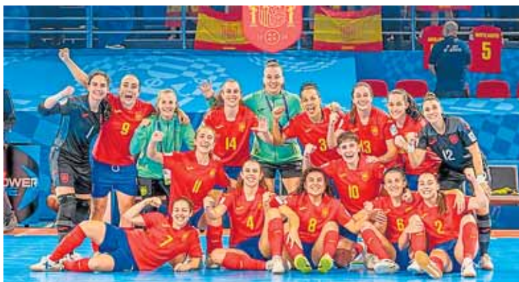
La selección española femenina, tras ganar la medalla de bronce.