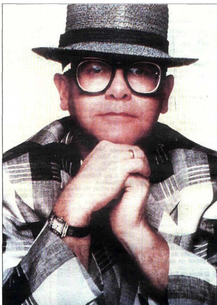
Elton John ha sido un músico que siempre ha cuidado su imagen

Preocupado por su imagen y con la batalla musical ganada, el artista, que ha confesado su bisexualidad, nació en 1947, en Pinner (Middlesex). A los cuatro años empezó a tocar el piano y, durante cinco años, recibió clases de música en la Real Academia. The Corvettes y Blueology fueron los primeros grupos de Elton John, que dió un giro a su carrera en 1970, año en el que conoció al letrista Bernie Taupin.