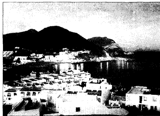
Preciosa vista de San José.