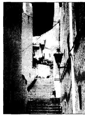
Angosta calle en Agua Amarga.