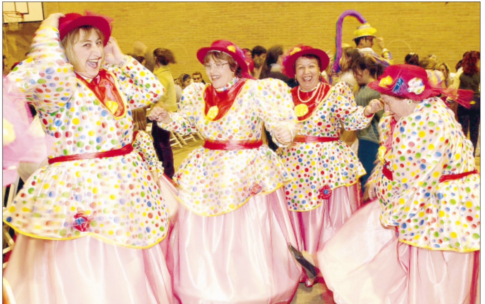
J. M. RODRÍGUEZ / AGM

Ramallo elogia de esta formación, más allá de complicidades