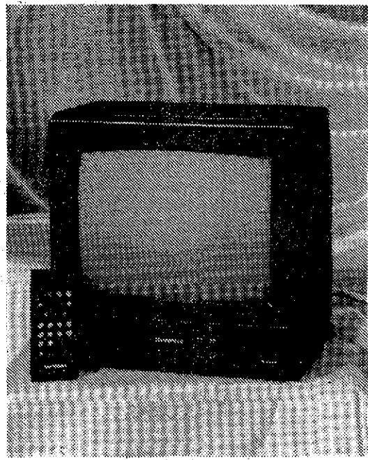
TV COLOR 14 PULGADAS TELEFUNKEN, MOD. MP-143, CON MANDO A DISTANCIA. INGRESANDO 255.000 PESETAS, A DOS AÑOS Y MEDIO.