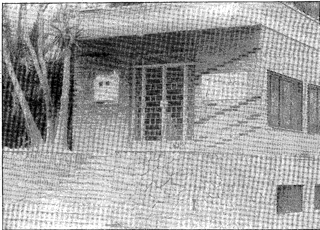
Exterior del 'Taller del Currante', de reinserción social.