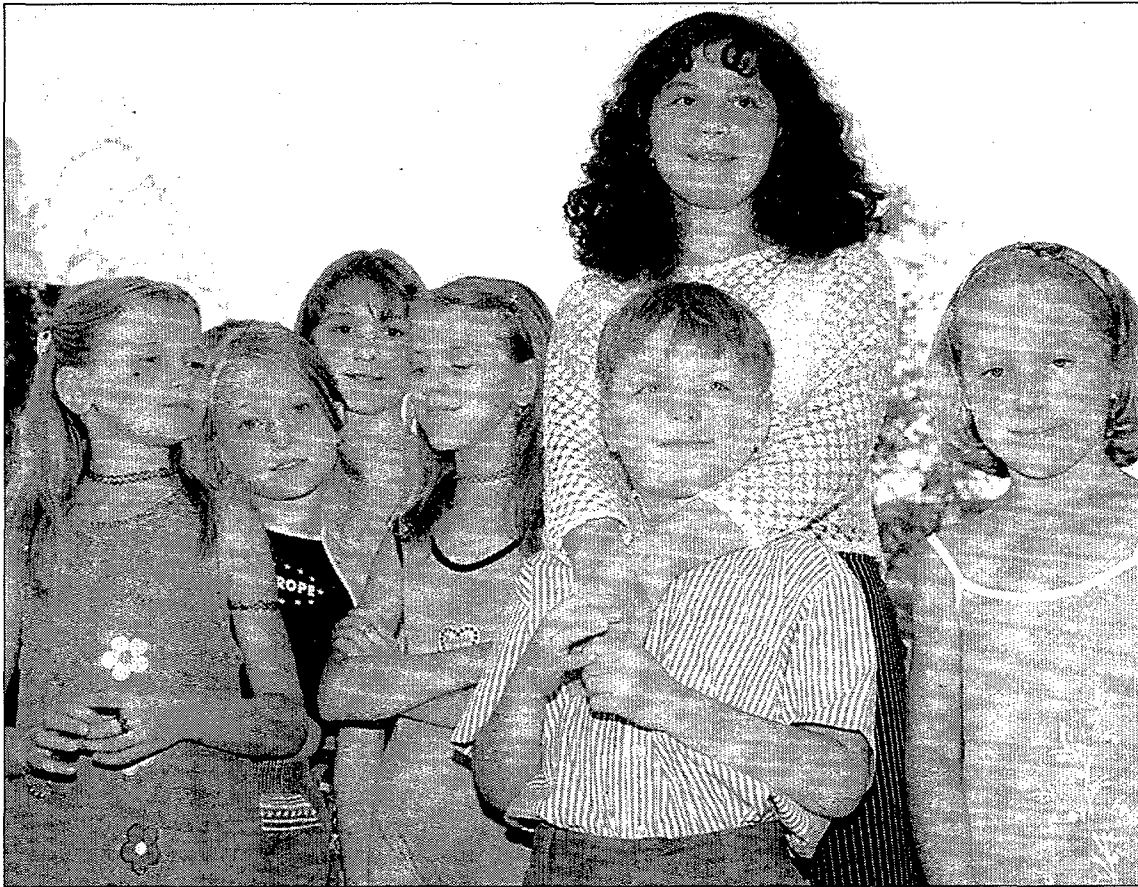
Varios de los niños bielorrusos acogidos por familias de Alguazas.