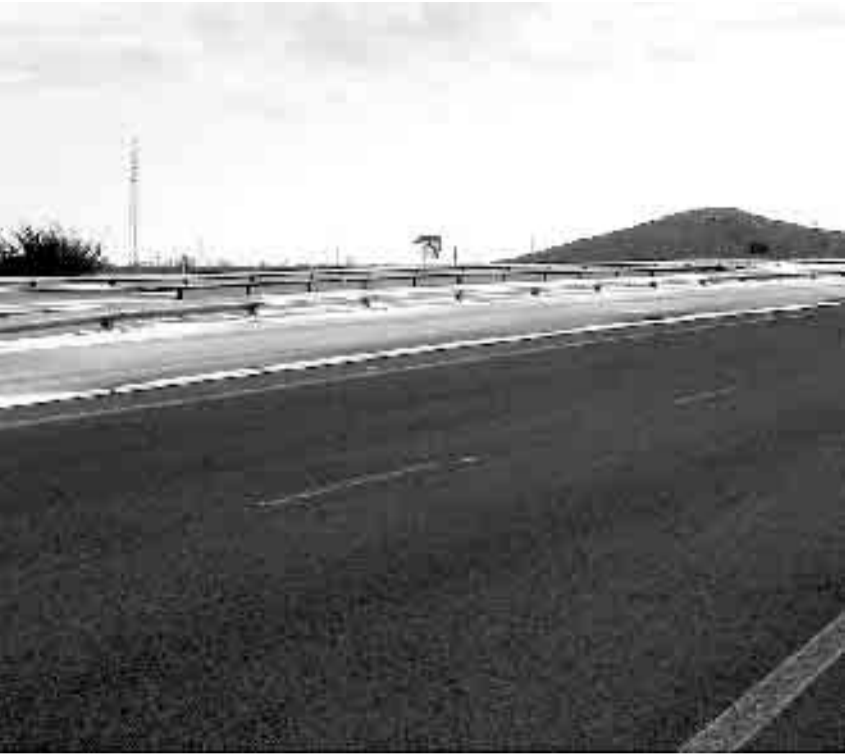
de la carretera de la La Manga. / LA VERDAD