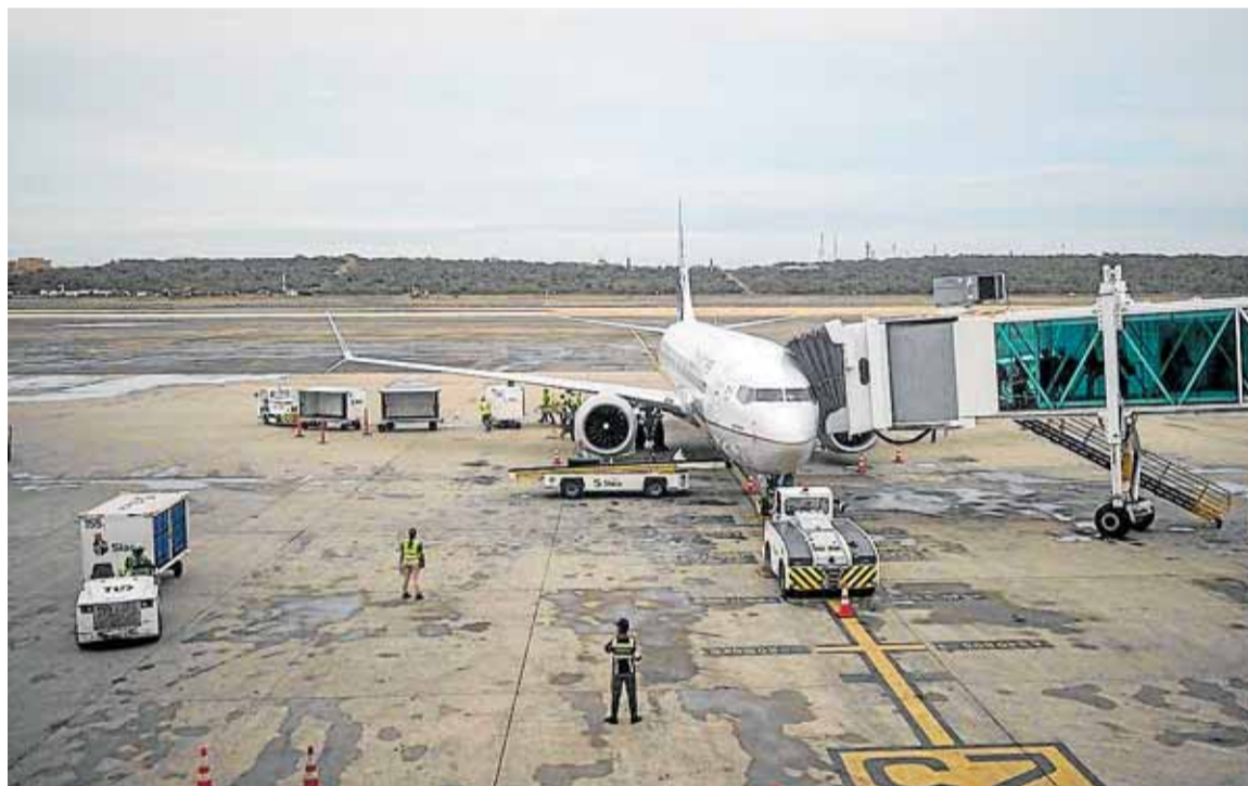
Un avión, durante las operaciones de embarque del pasaje.