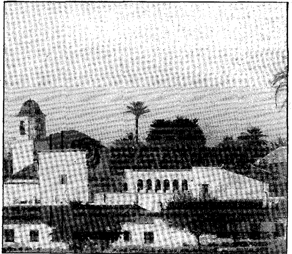
LAGUENA San Ginés, un monasterio a recuperar.