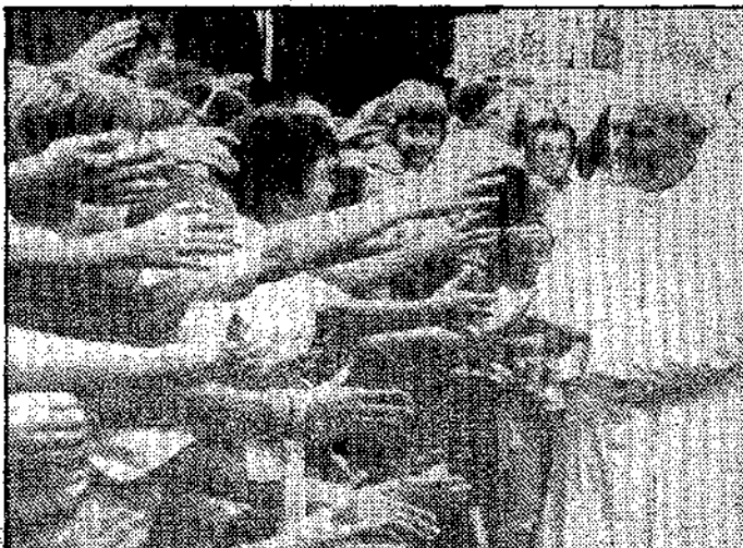
Fue un emocionante encuentro con los niños.

El Pontífice acabó dejando los papeles, y contagiado del