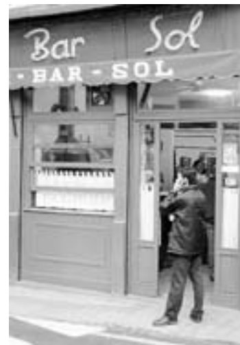
PARA ESPERAR. Bar Sol.

Un desayuno acompañando al desfile en su retorno viene muy bien a altas horas de la noche y en un buen sitio como el bar Sol, o en cualquier puesto de churros con chocolate situados en muchas