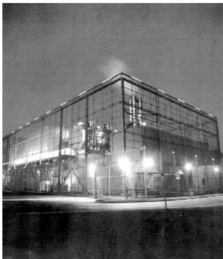
La planta de valoración de Burdeos, con sus chimeneas.

El Gobierno regional no ha decidido aún dónde ubicará la nueva instalación , que diseñará un arquitecto de prestigio