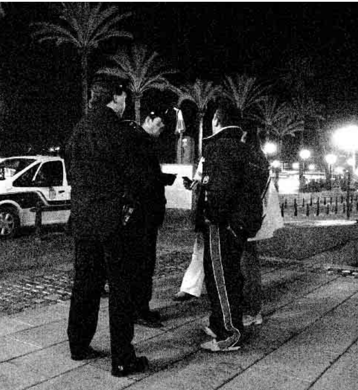
Policía Nacional hablan con unos jóvenes en una zona de bares, en foto de archivo.