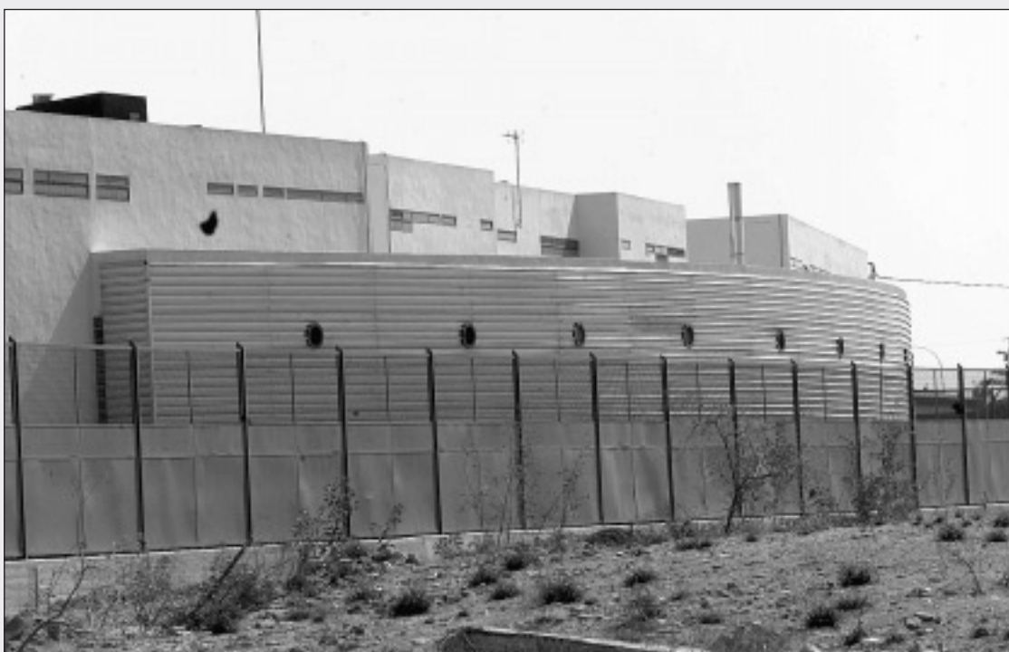
Imagen del exterior del Centro Educativo Juvenil de Sangonera.