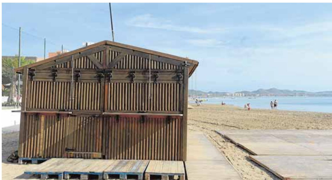
Un chiringuito cerrado en la playa del Cavana, en La Manga, en una imagen de archivo.