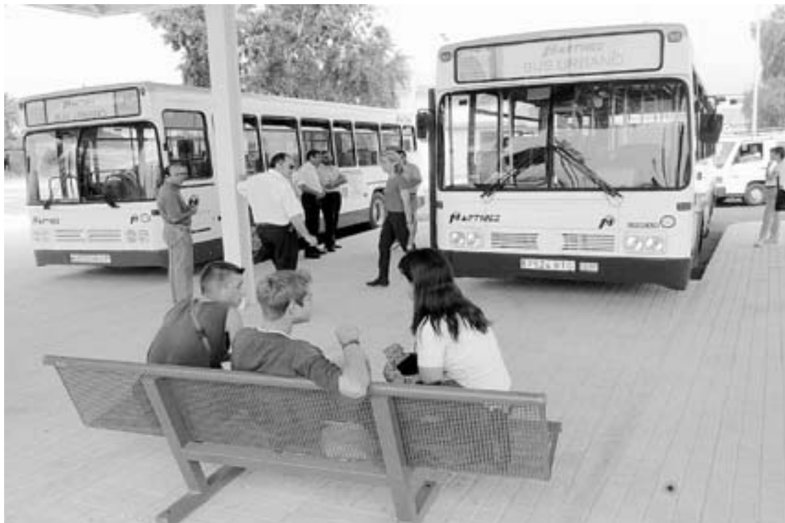
GRATIS. Los mayores de Totana podrán viajar gratuitamente en el autobús urbano.

El servicio funcionará de nueve y media de la mañana a seis y media de la tarde, de lunes a viernes, y está dirigido a mayores de sesenta años, vecinos de San Javier, que tengan reducida su autonomía y no padezcan enfermedades clínicas ni contagiosas.