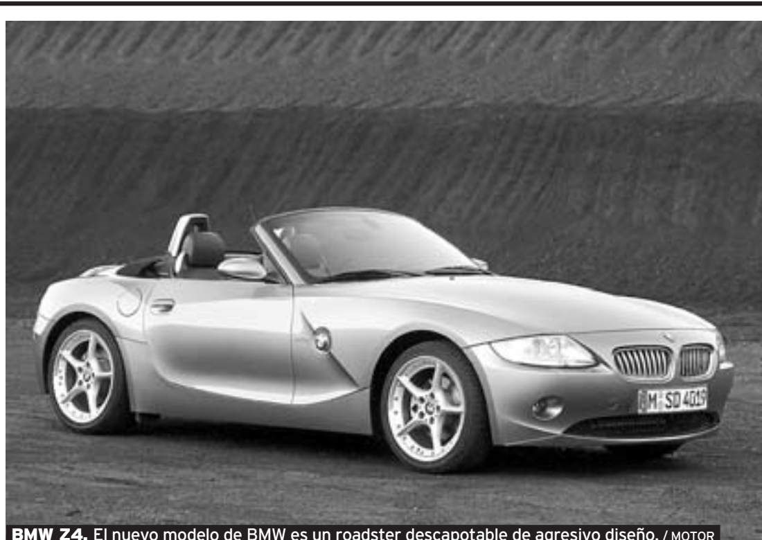
BMW Z4. El nuevo modelo de BMW es un roadster descapotable de agresivo diseño.

Durante esta semana, los interesados que no pudieron asistir a la muestra podrán disfrutar del mismo tratamiento aplicado a las unidades que quedan sin vender en las instalaciones que Mutrasa tiene en la carretera de Monteagudo (Murcia).