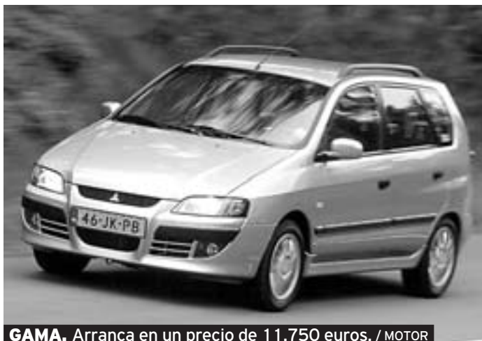
GAMA. Arranca en un precio de 11.750 euros. / MOTOR

Cuando el primer Space Star salió de la cadena de producción el 10 de julio de 1998, era ya considerado un vehículo de carácter crossover , mucho antes de que este nombre fuera acuñado y empezase a ser tan popular. Un vehículo que aunaba características de varios segmentos: tamaño compacto pero con