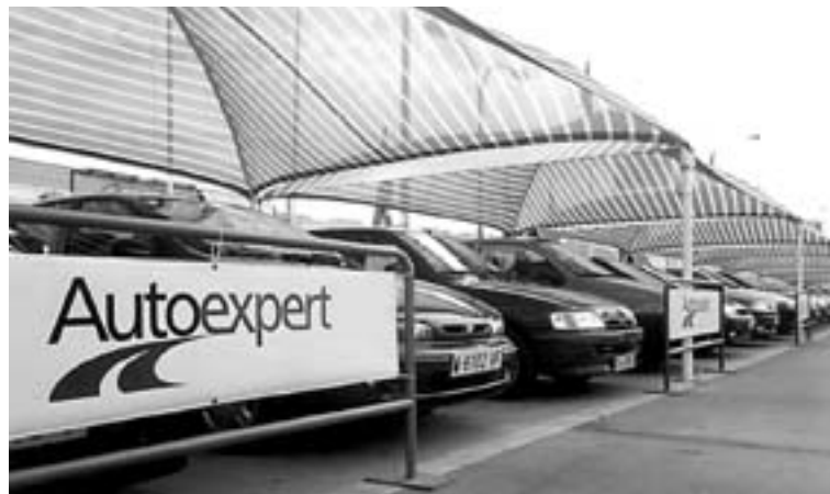
GARANTIA. Los coches de la muestra tienen la de Autoexpert. /