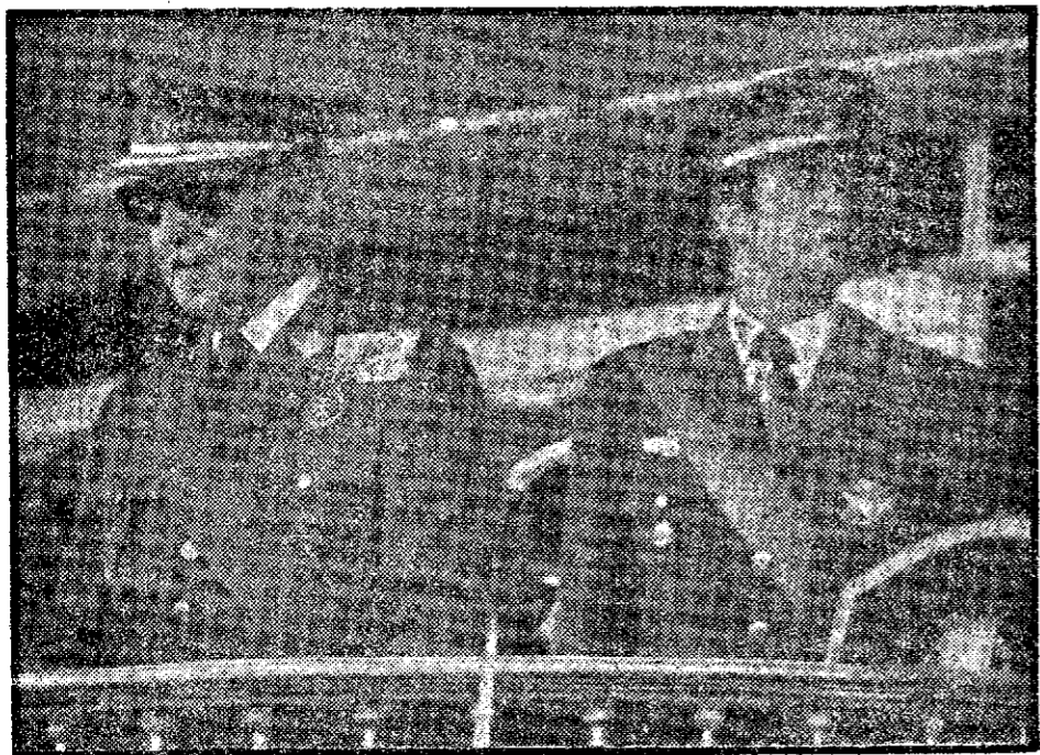
Esta foto, hecha durante un desfile de la Victoria, se ha convertido en una imagen expresiva del inmediato pasado y del presente de España.

El inmovilismo, el no saber atender con la rapidez indispensable las exigencias de los tiempos, pero también el catastrofismo, la propensión al borrón y cuenta nueva, el volver a empezar continuamente, han sido las grandes tentaciones de los españoles y la causa permanente de su inestabilidad histórica. Al pueblo español corresponde dar ahora la prueba de su madurez.