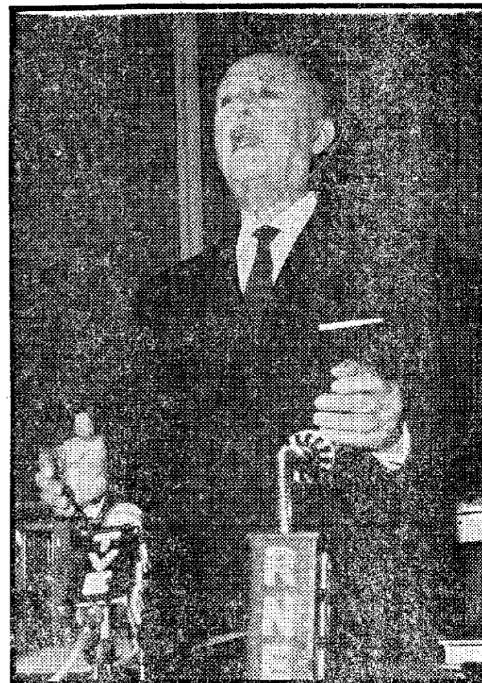
tuciones, alentar las necesarias evoluciones que aconseje el acontecer histórico y emprender nuevos progresos en todos los campos de la actividad humana."

"Podemos mirar al futuro con confianza, esperar que nuestra labor dé sus frutos, adaptar el detalle a la necesidad cambiante de cada circunstancia, observar el funcionamiento de nuestras insti-