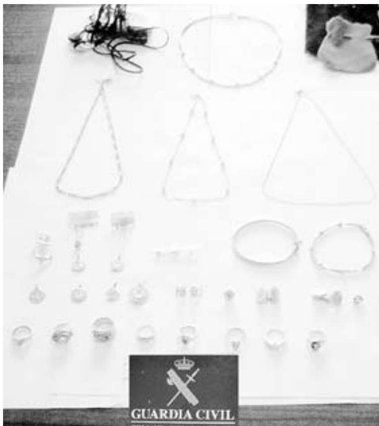
RECUPERADO. Algunas de las joyas incautadas a los ladrones.

En el momento de la detención, les fueron intervenidas diversas pequeñas joyas de oro y dos grandes destornilladores con los que forzaron la puerta, tras lo que se localizó el turismo con matrícula de Alicante con el que se habían desplazado a la urbanización. En su interior hallaron más joyas y otros pequeños objetos cuya sustracción había sido denunciada