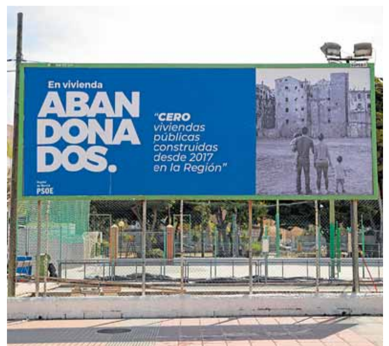
Una de las vallas instaladas por el PSRM en Cartagena. PSRM

Por su parte, la portavoz del PP en la Región, Miriam Guardiola, respondió a los socialistas que «ni con todos los paripés del mundo van a tapar su corrupción», justo en los días en los que se juzga a Ábalos.