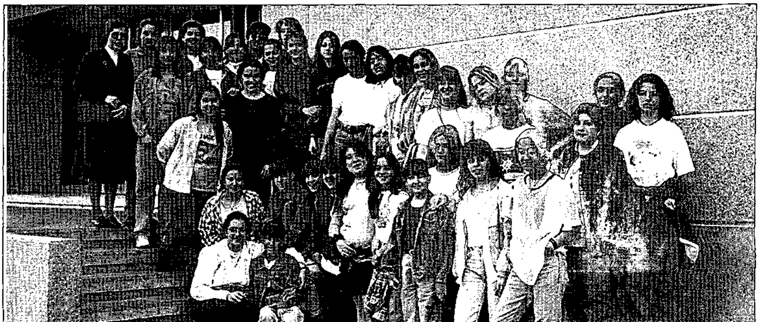
Colegio San Vicente de Paul, de Cartagena, en el periódico.