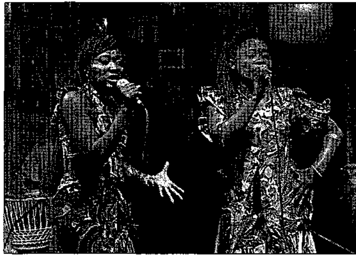
La Puerta Falsa, centro de inquietudes culturales.

No sé de quién habrá partido la idea de no convocar el Murcia joven de literatura, pero al igual que se publica en el B.O. regional la convocatoria y bases de los de pop-rock, fotografía, cómic, diseño de moda, artes plásticas y vídeo, ¿por qué no se publica el motivo o los motivos por los cuales no se convoca el que nos afecta al colectivo de escritores en general?