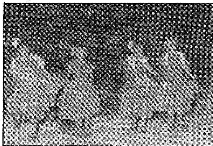
Un momento de la actuación infantil.

Instituto y los profesores ya se lo han pedido al Ayuntamiento y los alumnos, por su parte, se han comprometido a plantar árboles —de los que no son muy conocidos por esta zona— y a cuidarlos ellos mismos.