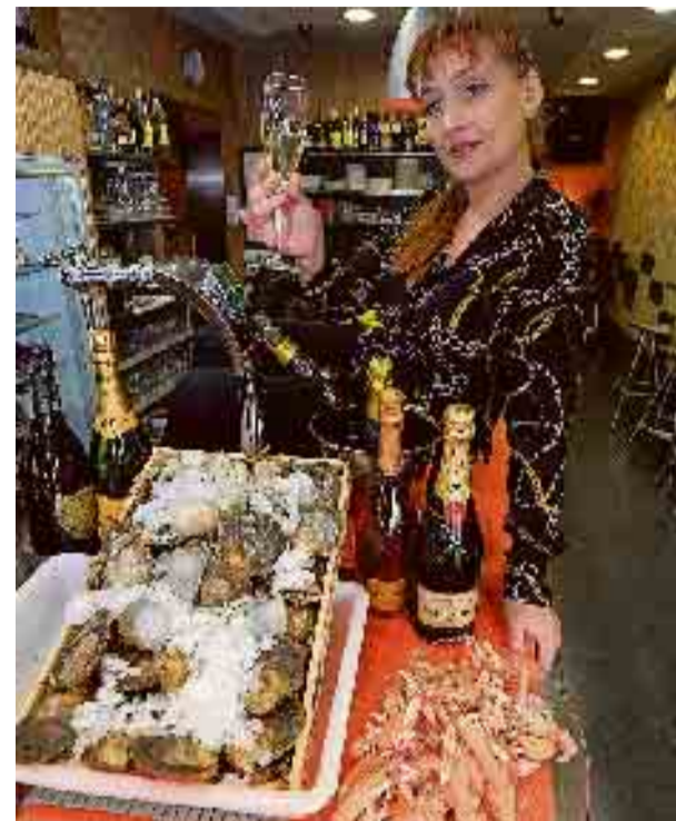
Trini, al frente de su negocio.