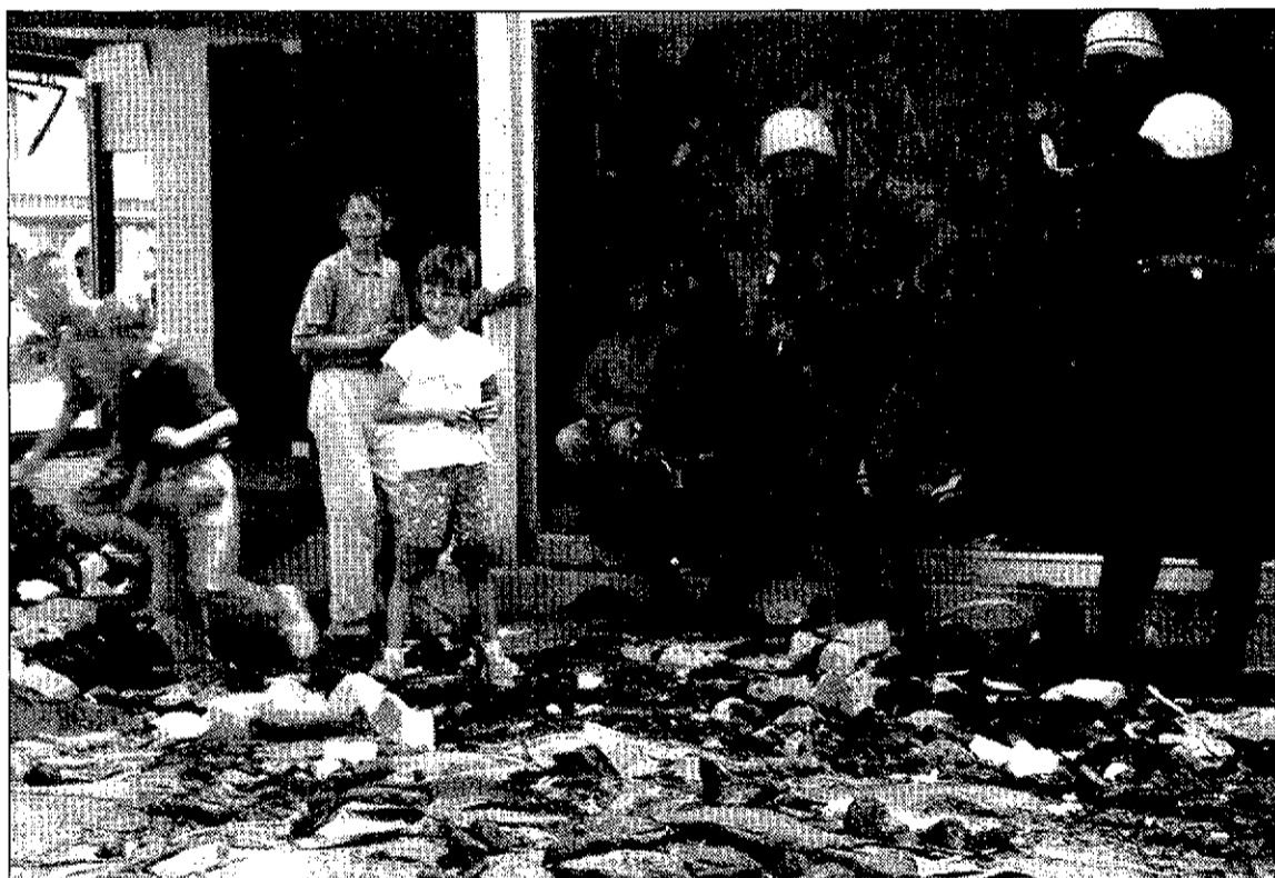
Un grupo de cascos azules españoles observa a unos niños, en Mostar.

Un total de doce soldados murcianos, que se encuentran actualmente en Bosnia-Herzegovina por su pertenencia a la Agrupación Táctica Canarias, regresarán a la Región en el plazo de un mes. La vuelta a sus respectivos cuarteles, junto al resto de españoles desplazados a la ex Yugoslavia, se debe a una decisión anunciada por el ministro de Defensa, Julián García Vargas, por la que se sustituye a la Agrupación Canarias, que lleva ya seis meses en misión de paz. La Agrupación Madrid será la que tome el relevo a la Canarias y estará compuesta por paracaidistas y soldados de caballería, aunque todavía no se han establecido las bases militares en las que serán reclutados los nuevos cascos azules españoles que viajarán a Bosnia. El contingente de cascos azules murcianos que actualmente reali-