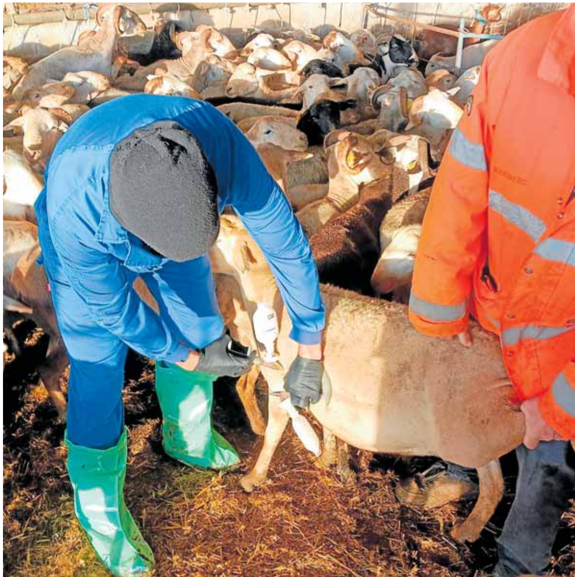
Vacunación contra la lengua azul en una explotación ganadera murciana de ovino, el pasado año.

Sin embargo, el sistema de vigilancia en la Región tiene un punto débil al que habría que poner solución ante el aumento de estas enfermedades. «Las ADS permiten tener a mucha gente en la calle, a nivel de