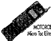
MOTOROLA Micro Tac Elite