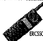
ERICSSON EH 238