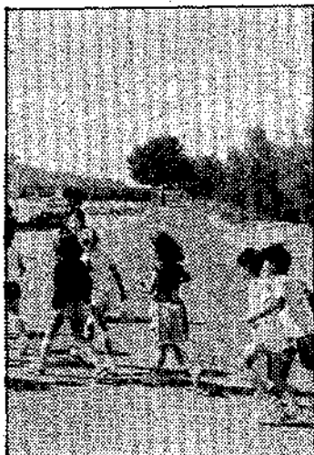
Protesta por el accidente de un alumna.