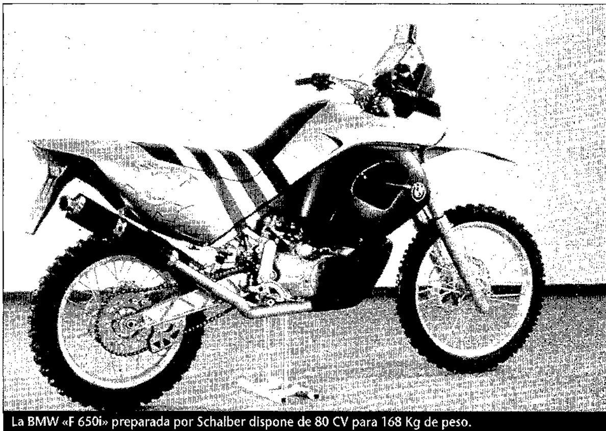
La BMW «F 650i» preparada por Schalber dispone de 80 CV para 168 Kg de peso.