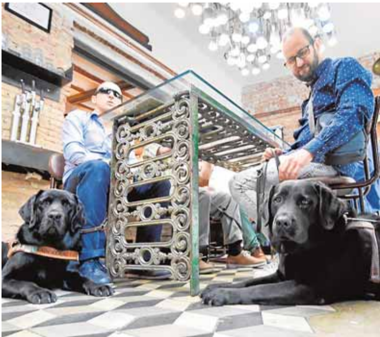
Dos usuarios de la ONCE, ayer, con sus canes.