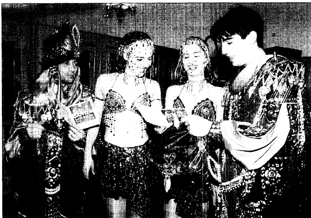
Varios festeros, durante la celebración del medio año festero, anoche.