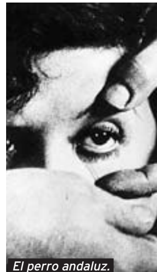
El perro andaluz.