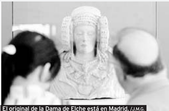
El original de la Dama de Elche está en Madrid.