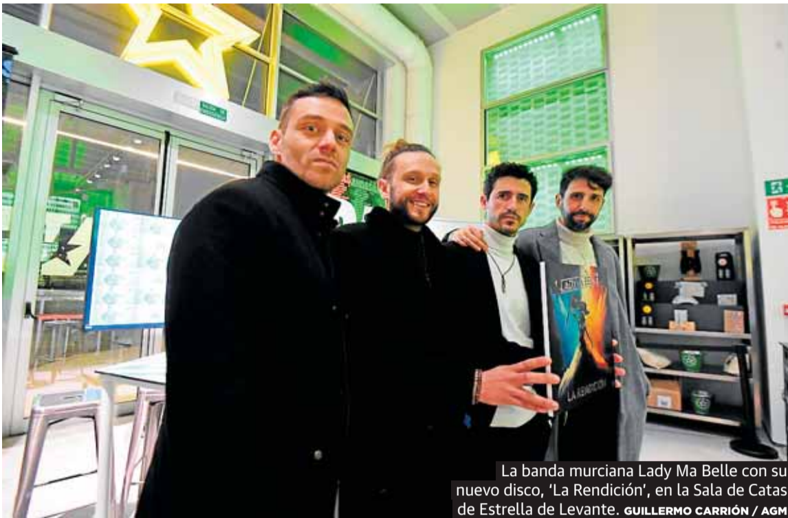
La banda murciana Lady Ma Belle con su nuevo disco, 'La Rendición', en la Sala de Catas de Estrella de Levante.