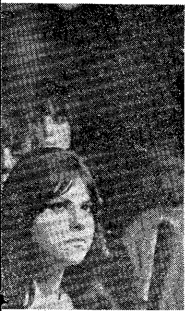
necesidades materiales de la cuna

...do al producir entre nosotros una concepción absolutamente empre- ...da», añadiría. Vistas las cosas desde el exterior, la situación del país Nadie ha logrado en tan poco tiempo igualar su nivel de bienestar. ...erencias entre pobres y ricos han sido más inexistentes. En poco más ...ciones, los suecos han pasado de la pobreza más absoluta al bienestar ...n sólo dos, del feudalismo a la socialdemocracia más avanzada. Pero ...ie poco. Se ha tendido al bienestar, y el bienestar le traeliona. So- ...p parecen coincidir la mayor parte de los absolutamente seguros, ab- ...mpios y absolutamente bien alimentados ciudadanos suecos con los que ... Pero la enfermedad tiene múltiples síntomas.