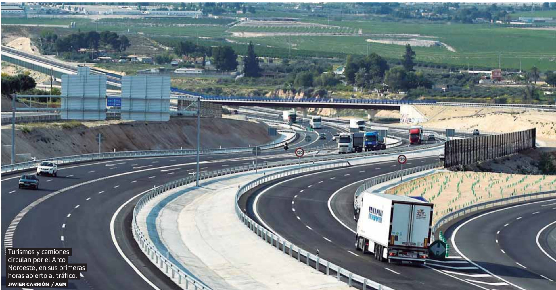
Turismos y camiones circulan por el Arco Noroeste, en sus primeras horas abierto al tráfico.