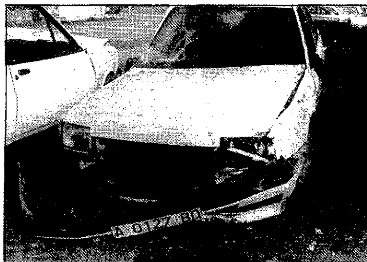
Estado del vehículo accidentado, tras la persecución.

El Renault 5 en que huía otro de los delincuentes fue alcanzado tras otra persecución de varios kilómetros en la carretera de Mazarrón,