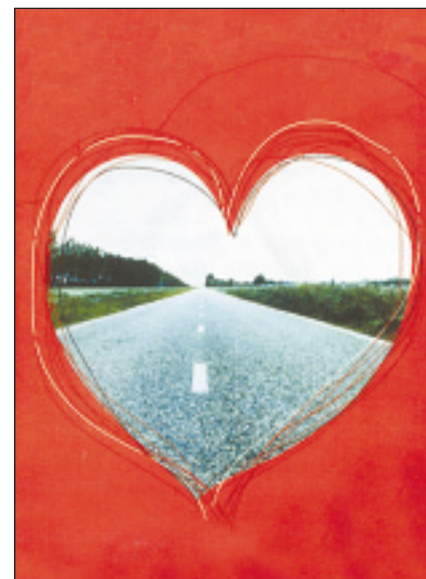
El directo al corazón de BMW. / VECINOS

de distinguir los spots de BMW de los cientos de anuncios que conviven en las parrillas televisivas.