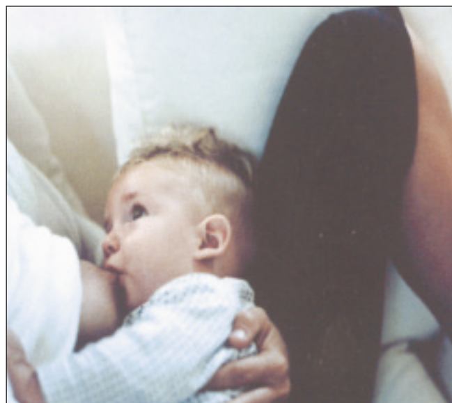
Imágenes de uno de los spots de la campaña No es lo mismo .