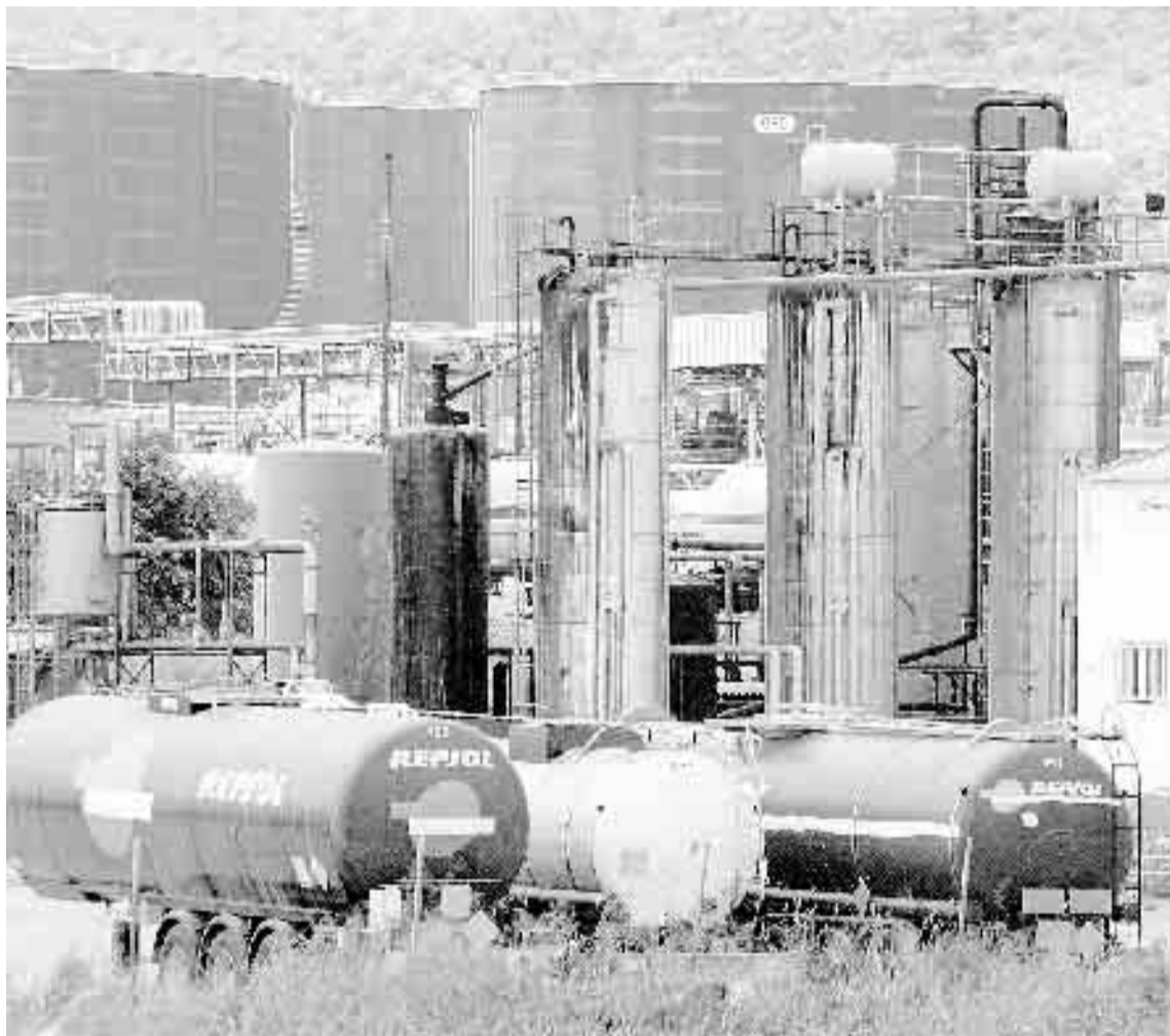
REFINERÍA. Camiones de la compañía de Repsol junto a la instalaciones de Escombreras.

Además de éstas, hay que tener en cuenta que en la refinería de Cartagena ya existen 80 empresas calificadas (subcontratas) para trabajar con Repsol cuando ésta solicita alguno de sus servicios en la producción del combustible o alguno de sus derivados. Para el proyecto de ampliación, cuya