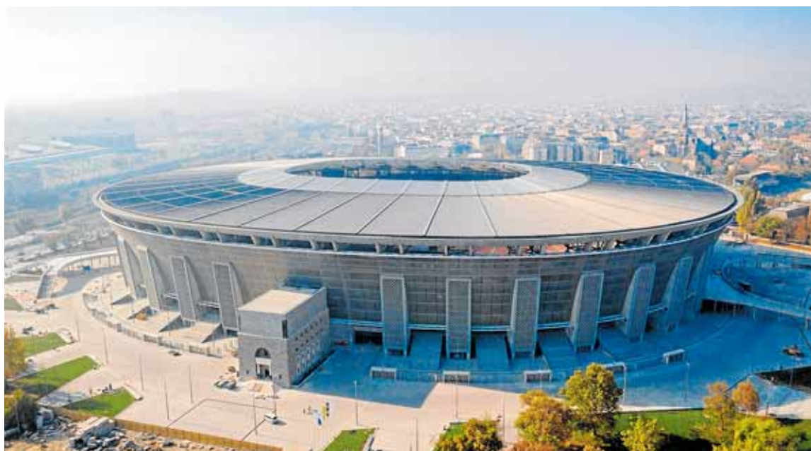
El Puskas Arena de Budapest acogerá la final de la presente edición de la Champions.

rado en gastos, 293,5 millones en la ventana estival que les han permitido robustecer la plantilla con figuras que están llamadas a darles un nuevo salto de calidad como Martín Zubimendi, Eberechi Eze o Viktor Gyökeres.