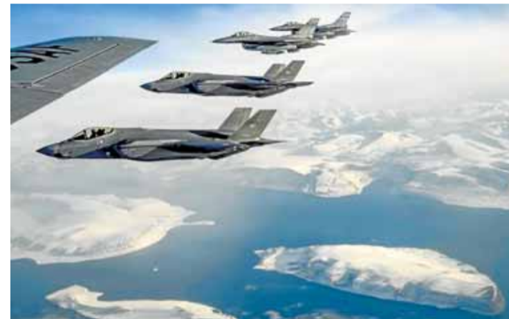
Aviones norteamericanos sobrevuelan Groenlandia