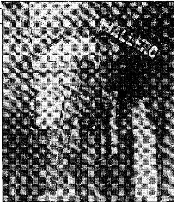
Los vecinos de la calle de Caballero buscan revitalizar la zona. DAMIAN

Lo que pasó fue que como ni los más ancianos del lugar —y nunca mejor aplicada la frase tópica, porque esto no había ocurrido jamás— tenían constancia de que «nuestros muchachos» ganaran nada menos que por 5-1 a los favoritos de Dinamarca, y que encima, un mozalbete al que dicen «El Buitre» se marcó el solo cuatro goles, pues hubo exaltados que se lanzaron a las calles con sus coches haciendo sonar los claxons. Y es que, lo comprendemos, habían que exteriorizar el júbilo de alguna forma. Pero, calma, dejemos